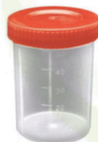
Fezes e urina